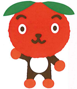
香春町イメージキャラクター カッキーくん

※各町村での証明については取扱等が異なる場合がありますので、事前に創業を予定している各町村の商工会へお問い合わせ下さい。創業計画書完成後、修了証の発行となります。